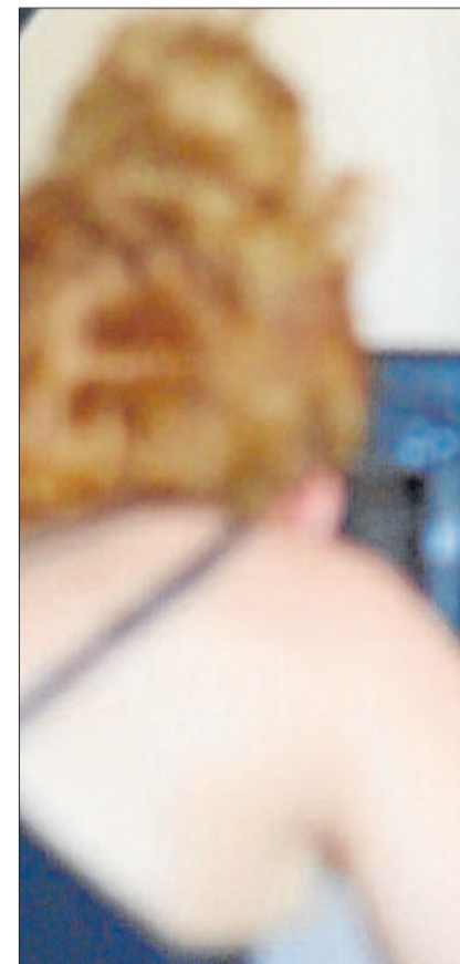
Un moment de la sessió fotogràfica

Comenten que es tracta d'un projecte que «haviem pensat feia temps, però comporta molta dedicació i una feina prèvia d'explicar, contactar i engrescar els col·laboradors necessaris». Aquí, van tenir una aliada