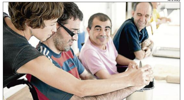
Imatge d'arxiu del Servei d'Atenció diürna d'Ampans

La voluntat de l'Ajuntament és reconèixer la feina feta i premiar el que es considera un mèrit extraordinari per l'impacte positiu que ha tingut en els propis afectats i les seves famílies durant el darrer mig segle així com en l'entorn on ha desenvolupat aquesta tasca.