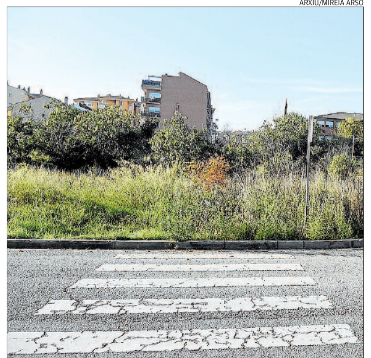
Solar davant del Pius Font i Quer, entre la Pau i el Camí Vell de Santpedor

A part dels recursos humans i tècnics, el nou edifici incorporarà la tecnologia com a eina per millorar la qualitat de vida.